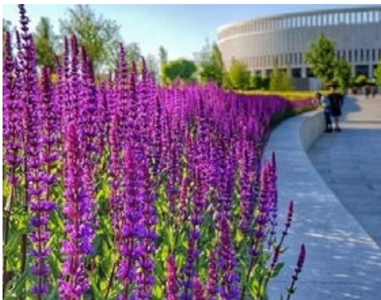
Лавандовые поля во Франции